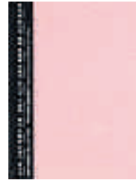
Wie China debattiert. Neue Essays und Bilder aus China Herausgegeben von der Heinrich-Böll-Stiftung, Berlin 2009. 195 S., € 10.–.